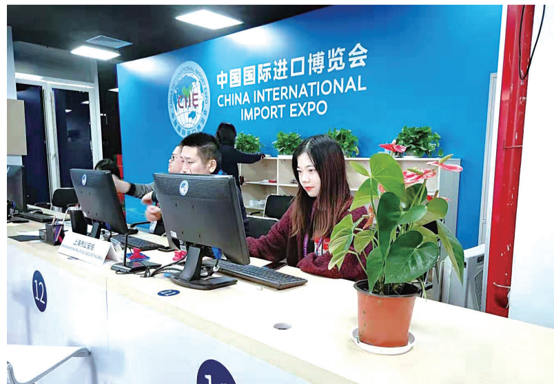
农行志愿者在进博会注册及证件管理中心工作场景。