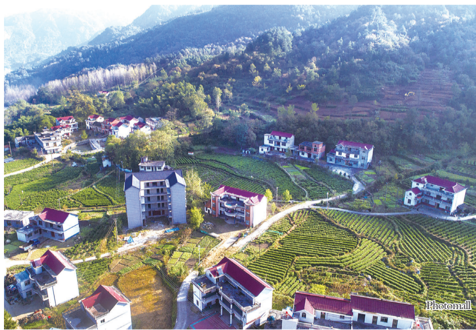
在农行帮扶下,安徽六安金寨县花石乡大湾村117户贫困户顺利脱贫。