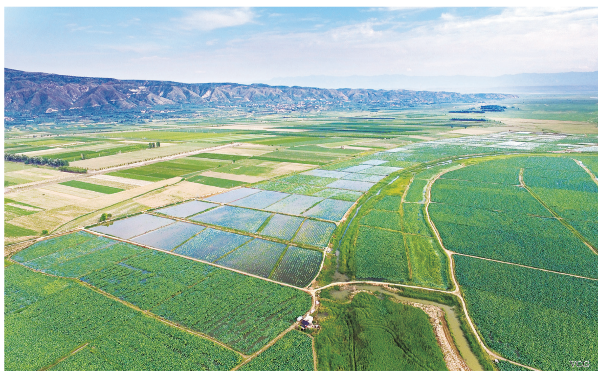
山西省运城市引黄河水浇灌农田，成为全国重要农业生产基地。图为航拍镜头下的运城黄河岸边农田。

黄河虽然流经山西，但山西的气候却是十年九旱，灌溉在当地农业生产和粮食安全中占有十分重要的地位，其中尤以改善引黄灌溉设施最为重要。近年来，山西省推出了以应急水源、农村水利灌溉、城乡节水等六大水利工程为主要内容的“兴水战略”，陆续启动了“南、北、中引黄”、七河流域治理、百座小型水库项目以及大管网县城供水等水利工程建设。