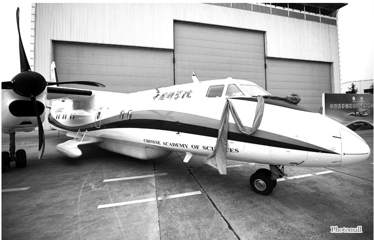
近日,第二架国产新舟60遥感机交付验收仪式在西安市阎良区举行,至此我国自主研发的两架高性能新舟60遥感飞机全部交付中国科学院。