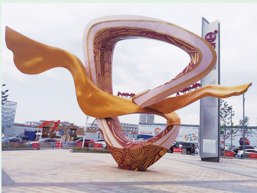
▲摄影《沙漠之旅》 农行新疆分行营业部 梁宏玮