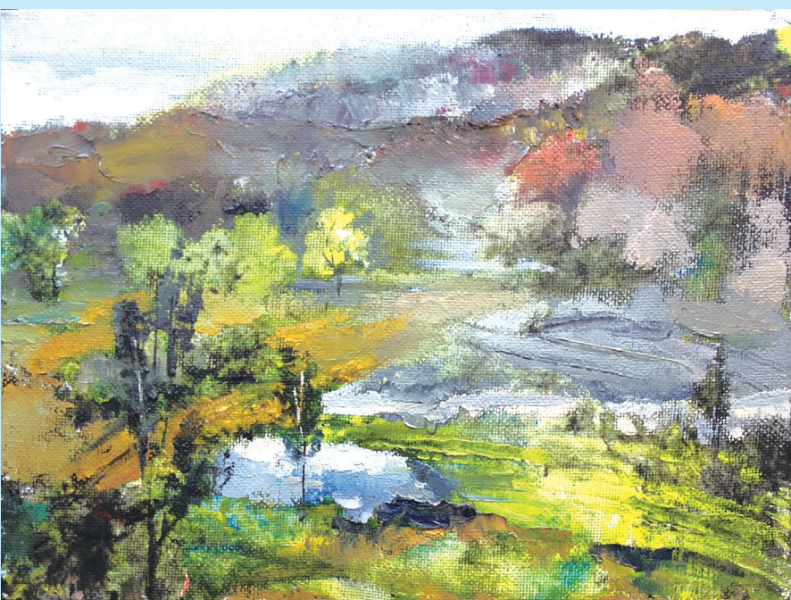
▲绘画《桃花源》 农行安徽凤阳县支行 孙明