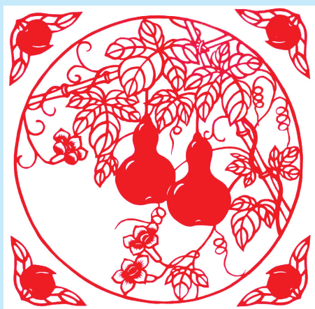
▲剪纸《福禄寿》 农行甘肃天水分行 王保军