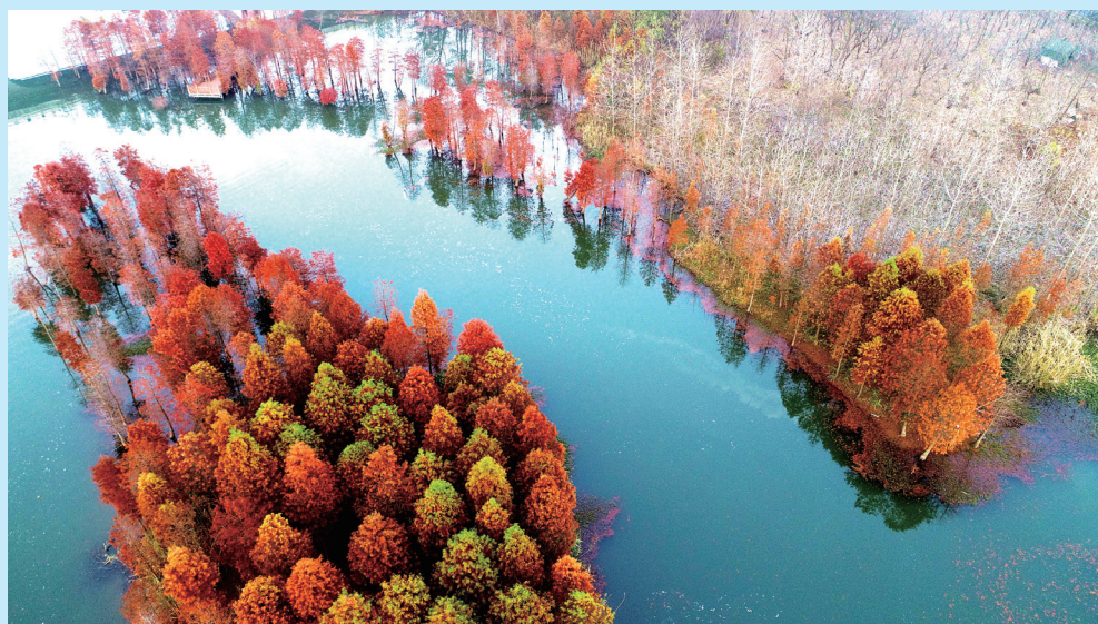
▲摄影《缥缈仙境天泉湖》