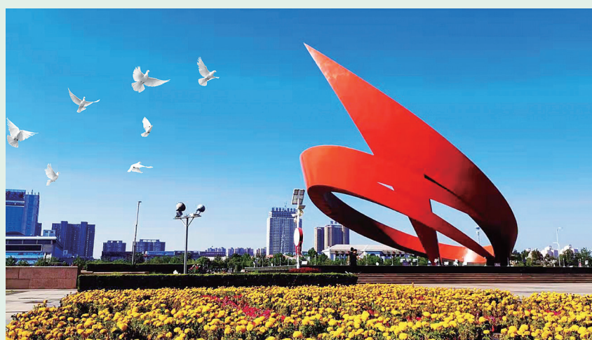
▲摄影《世纪风》 农行山东德州分行 宫玉河