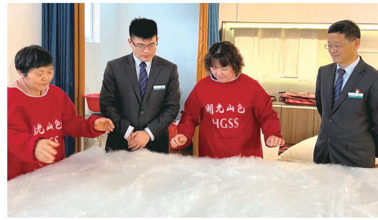
农行工作人员在蚕桑企业调研。