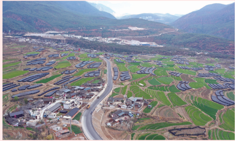
俯瞰迪庆州香格里拉市三坝乡白地村羊肚菌种植基地。